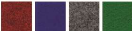
NEEDLE PUNCH CARPET RED/BLUE/GREY/GREEN