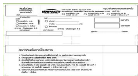
ตัวอย่างบัตรบันทึกเวลาเข้า-ออก

3.1.4 เมื่อส่งสินค้าหรืออุปกรณ์เสร็จเรียบร้อยแล้ว ให้ท่านนำรถของท่านกลับไปจอดที่ลานทะเลสาบ (Lake side หรือ ลาน Pre-Loading หรือ ลาน Delivery bay หรือให้นำรถออกนอกพื้นที่จุดขนถ่ายสินค้าโดยทันที