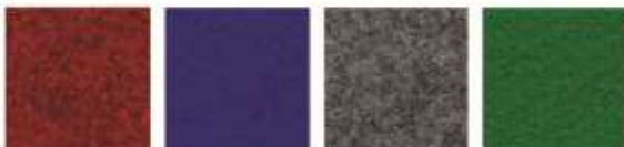
NEEDLE PUNCH CARPET RED/BLUE/GREY/GREEN