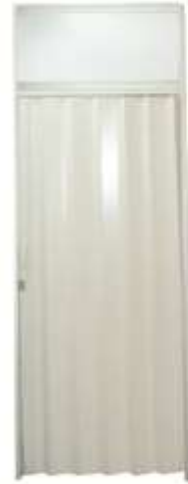
FOLDING DOOR 100x200 CM (SYSTEM BUILT)