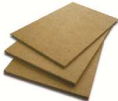
WOOD PLATFORM WITHOUT CARPET