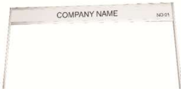
FASCIA BOARD WITH STANDARD LETTERING 10CM. HIGH 100x30 CM