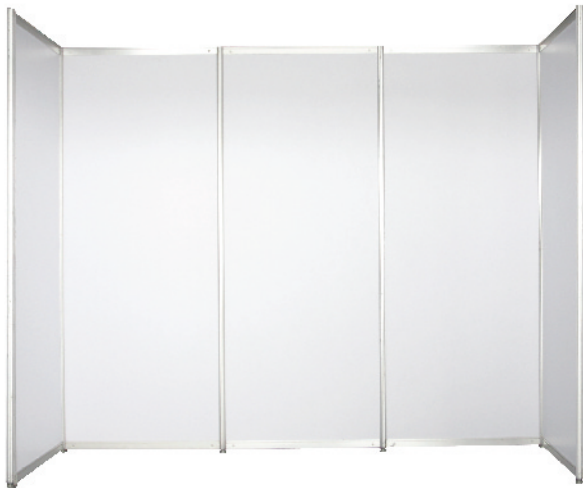
PANEL 100x250 CM (SYSTEM BUILT)