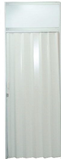
FOLDING DOOR 100x200 CM (SYSTEM BUILT)