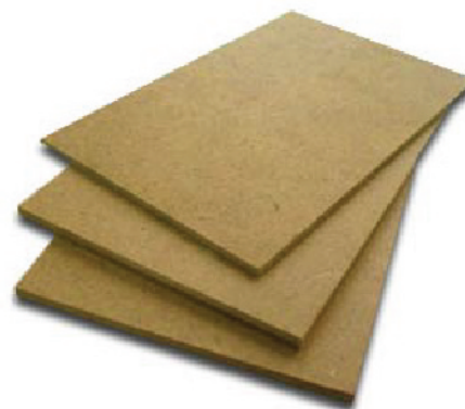
WOOD PLATFORM WITHOUT CARPET