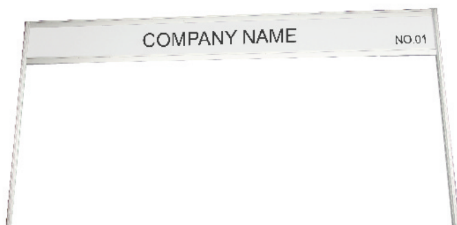
FASCIA BOARD WITH STANDARD LETTERING 10CM. HIGH 100x30 CM