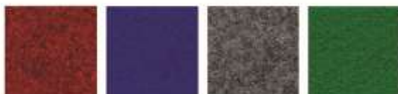
NEEDLE PUNCH CARPET RED/BLUE/GREY/GREEN