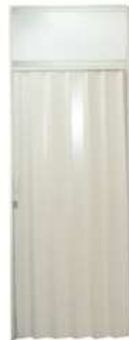
FOLDING DOOR 100x200 CM (SYSTEM BUILT)