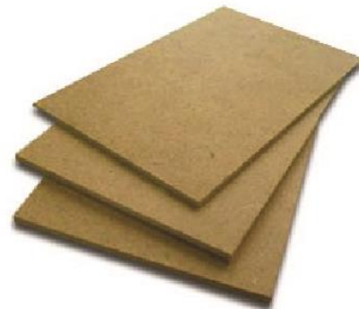
WOOD PLATFORM WITHOUT CARPET