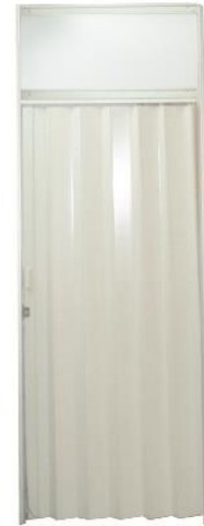
FOLDING DOOR 100x200 CM (SYSTEM BUILT)