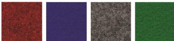
NEEDLE PUNCH CARPET RED/BLUE/GREY/GREEN