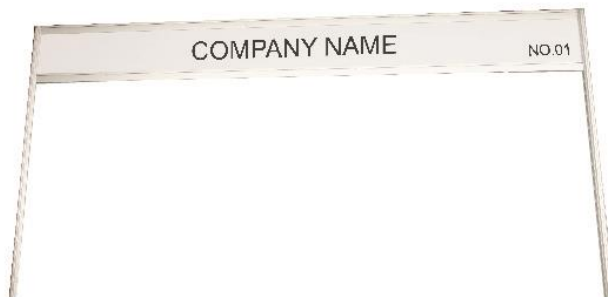
FASCIA BOARD WITH STANDARD LETTERING 10CM. HIGH 100x30 CM